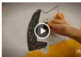
Una performance artistica con Intono