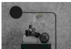
Alcantara per le cuffie Amiron wireless copper di beyerdynamic